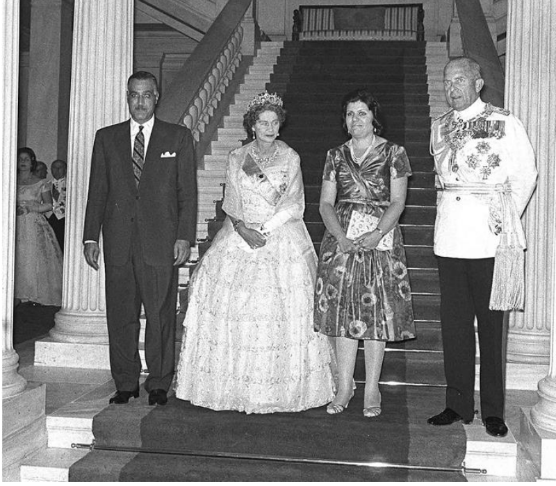
من بول ملك اليونان، إلى فخامة السيد جمال ء